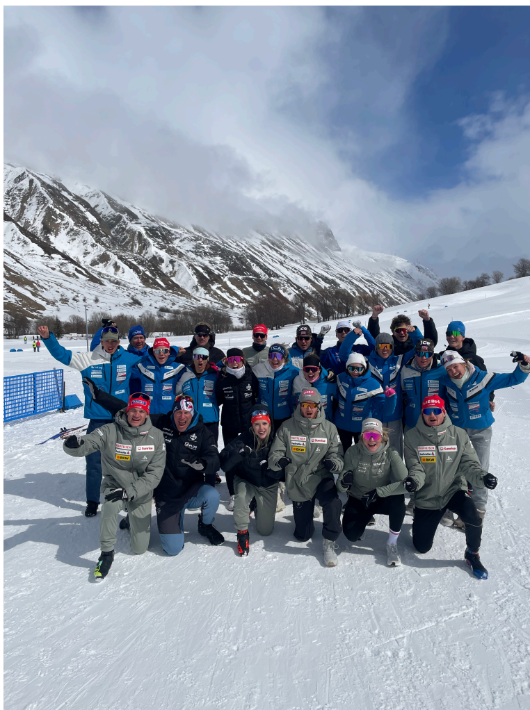
RLZ / ZSV Kader Athleten und Betreuer an der SM in Realp

Auch diese Saison startete der Swissscup mit 6 Austragungen in der Lenzerheide wie schon das Jahr zuvor. Gefolgt von Sclamischot, Notschrei, Prémanon, Ulrichen und der SM in Realp.